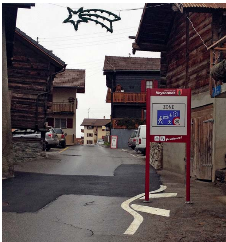
Entrée zone de rencontre à Ousse.

Pour rappel et à titre préventif, voici les règles usuelles de circulation concernant la zone « rencontre » et la zone « 30 km/h » :