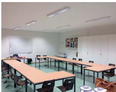
Nouvelle salle de classe à l'emplacement de l'ancien préau.