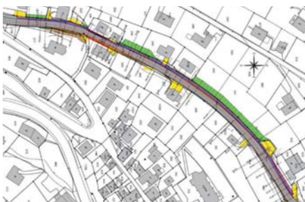
Situation du projet.