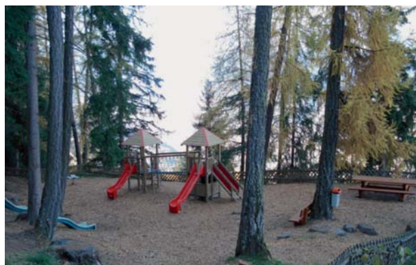
Place de jeux aux Mayens-des-Loges (en aval du bisse de Vex).