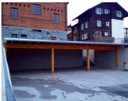
Nouveau couvert sur la cour d'école.