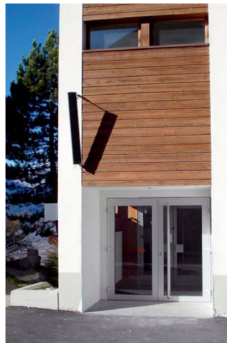
Nouvelle entrée du centre scolaire côté sud.