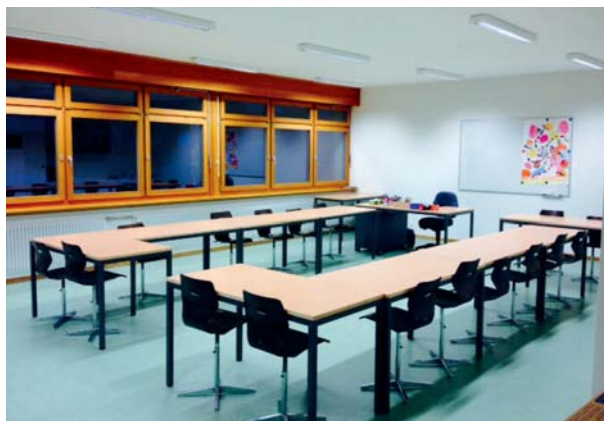
L'ancien préau a été transformé pour accueillir la nouvelle salle de classe

Durant les travaux, les WC du rez-de-chaussée ont également été adaptés pour répondre aux normes pour les personnes à mobilité réduite. Les enseignants profitent également d'un nouvel espace au rez inférieur qui accueille désormais la salle des maîtres. Toutes les classes primaires sont également équipées de matériel informatique et de beamers au plafond.