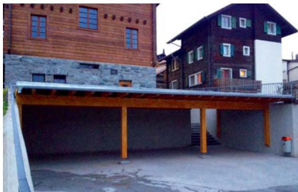
Un nouveau couvert en bois offre un large espace abrité sur la cour d'école.

Durant les vacances d'automne le nouveau couvert en bois a été posé au Sud de la cour d'école, en contrebas de la maison communale. Il offrira aux élèves un abri bienvenu lors des récréations pluvieuses et aux sociétés locales une espace couvert pour les diverses manifestations. Cet espace compense l'ancien préau désormais transformé en salle de classe.