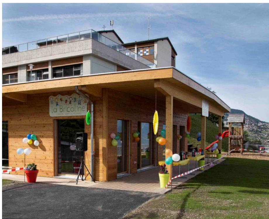
Vendredi 7 septembre, fête des 5 ans, 16 h 30 à la Bricoline