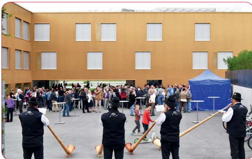
Après les discours, place à un intermède musical.