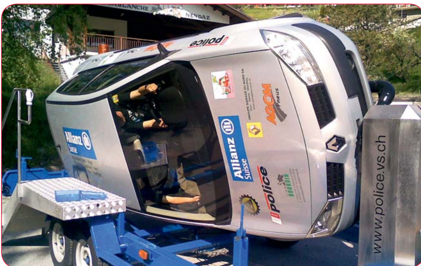
Au cycle d'orientation, les élèves peuvent vivre en toute sécurité, les impressions vécues en réalisant des tonneaux avec la voiture. Ceinture de sécurité plus que recommandée !

Tout au long de leur scolarité, les élèves participent, au moins une fois par année, à un cours d'éducation routière. Les plus petits reçoivent leur petit triangle jaune à porter autour du cou et apprennent à traverser la route. En fin de 2H, ils devraient être à même de la traverser seuls et connaissent les mauvais comportements à éviter. En 5H et 6H, c'est en vélo qu'ont lieu les cours de prévention (maîtrise du vélo, équipement, parcours d'agilité, ...). Plus grands, leur est encore expliqué la place des engins assimilés à des véhicules dans la circulation (trottinette, skate, ...). Ils font également l'expérience d'un choc à 7 km/h grâce à l'utilisation d'une sorte de simulateur. Au cycle d'orientation, il est question plus précisément des différents permis qui leur deviennent accessibles (agricole et vélomoteur) ainsi que des conséquences des accidents de la route (physiques, psychologiques, financières).