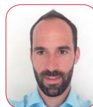
Fabrice Fournier © DR