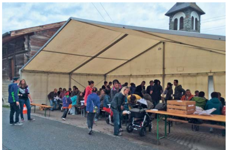
Le repas de midi sous la tente au centre du Village... une belle assemblée!