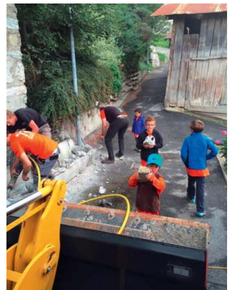
Travaux de réfection du bassin au chemin de la Tsintre.

La sauvegarde du patrimoine et des traditions a également incité les jeunes à remettre en fonction le four banal. Ce week-end du 12 septembre, des fournées de pain fraîchement pétri par les jeunes avec l'aide du boulanger, ont à nouveau depuis 10 ans, embaumé l'air du village. Des pains qui ont rapidement trouvé preneur auprès de la population locale. Finalement, l'Action 72 Heures a été couronnée par l'organisation d'un grand brunch le dimanche au centre du village. Le partage a marqué ces 72 heures de la vie de notre commune. Félicitations aux jeunes pour leur engagement et leur volonté qui démontrent leur attachement à Veysonnaz, ainsi que l'esprit d'équipe et l'entraide qui règnent parmi leur génération.