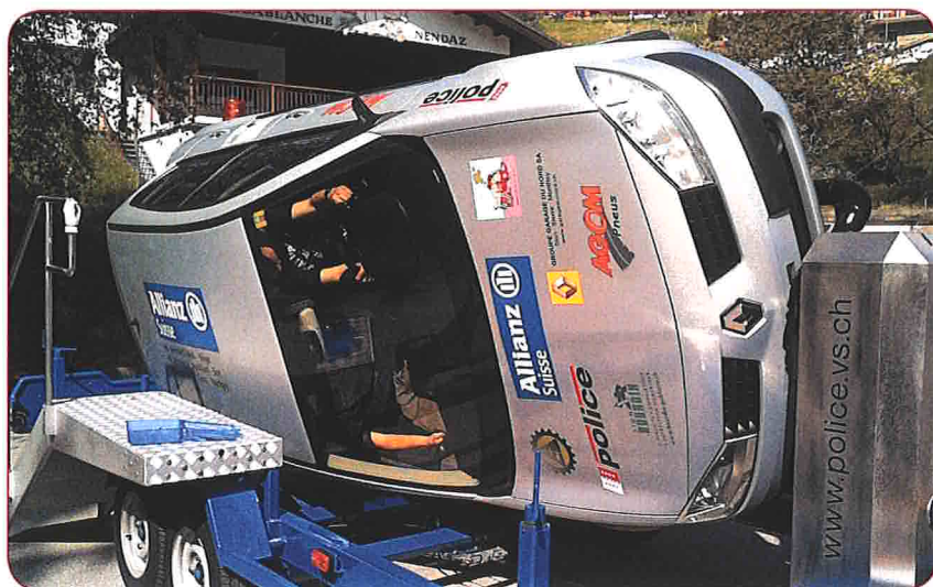
Au cycle d'orientation, les élèves peuvent vivre en toute sécurité, les impressions vécues en réalisant des tonneaux avec la voiture. Ceinture de sécurité plus que recommandée !

Tout au long de leur scolarité, les élèves participent, au moins une fois par année, à un cours d'éducation routière. Les plus petits reçoivent leur petit triangle jaune à porter autour du cou et apprennent à traverser la route. En fin de 2H, ils devraient être à même de la traverser seuls et connaissent les mauvais comportements à éviter. En 5H et 6H, c'est en vélo qu'ont lieu les cours de prévention (maîtrise du vélo, équipement, parcours d'agilité, ...). Plus grands, leur est encore expliqué la place des engins assimilés à des véhicules dans la circulation (trottinette, skate, ...). Ils font également l'expérience d'un choc à 7 km/h grâce à l'utilisation d'une sorte de simulateur. Au cycle d'orientation, il est question plus précisément des différents permis qui leur deviennent accessibles (agricole et vélomoteur) ainsi que des conséquences des accidents de la route (physiques, psychologiques, financières).