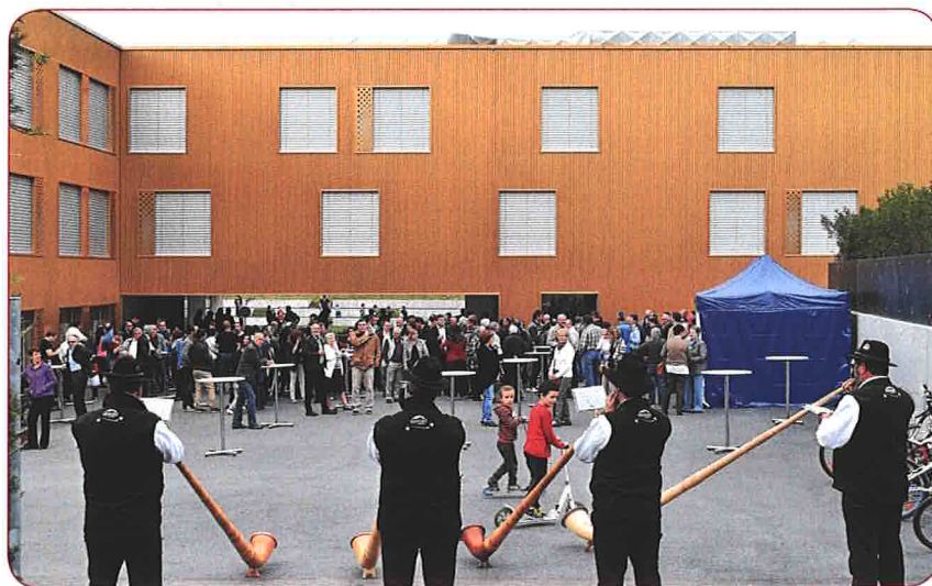
Après les discours, place à un intermède musical.