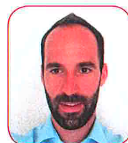
Fabrice Fournier © DR